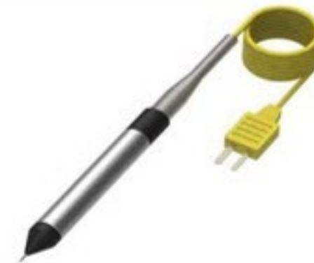
Sonde de température