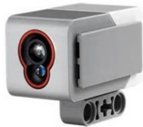
Capteur de couleur

Que ce soit dans l'industrie, la recherche scientifique, les services, les loisirs, le sport... il est utile de mesurer ou contrôler des grandeurs physiques comme la force, la température, la vitesse, la position, la luminosité, le bruit,... pour cela nous avons besoin d'utiliser des capteurs .